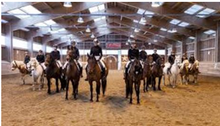
Slika 2 Šola Grottenhof Hardt