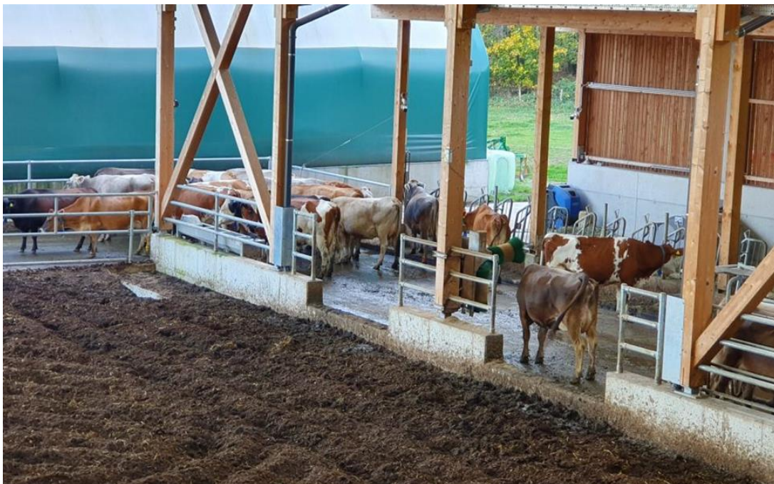
Slika 3 Kompostni hlev na šoli Grottenhof