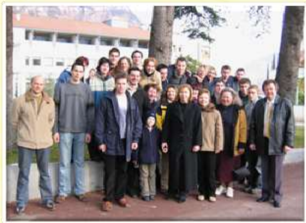
Ekipa naših Šentjurčanov na Južnem Tirolskem, februar 2004.

V šol. letu 2002 smo pričeli s projektom Leonardo da Vinci, »Sadjarstvo in vinogradništvo v EU«, ki smo ga odlično udejanili s sadjarsko-vinogradniško šolo Laimburg. Projekt je na njihovi šoli organiziral prof. Maier. Naši dijaki so spoznali Južno Tirolsko, razvito kmetijstvo in turizem, razvito podeželje in urbano okolje, spoprijateljili so se s tamkajšnjimi dijaki, imeli so pouk sadjarstva in nemškega jezika, izvajali so praktični pouk v sadovnjakih tamkajšnjega Sadjarsko-vinogradniškega inštituta Laimburg. Naučili so se zimske rezi na različnih sortah sadnega drevja. Ta projekt je trajal do leta 2004.