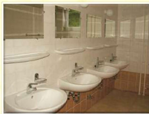
Kopalnica v prvem nadstropju.

Dijaki so se udeležili regijskega tekmovanja za Domijado v Škofji Loki. Ministrstva za šolstvo in šport je uredilo kopalnice v I. nadstropju dijaškega doma.