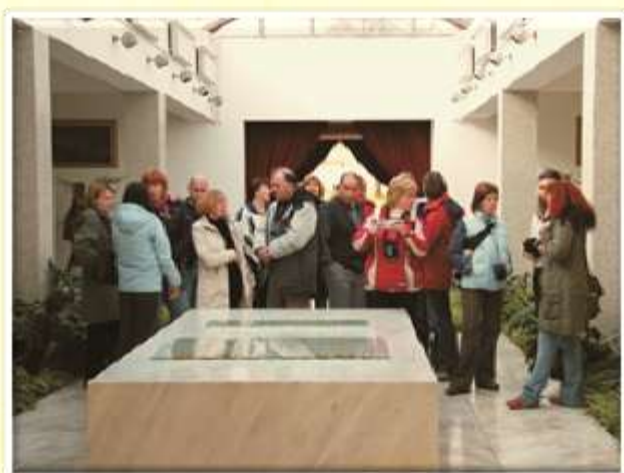
Hiša cvetja v Beogradu nas je pričakala v klavirni podobi.

V zadnjem desetletju smo prešli iz enodnevnih ekskurzij po Sloveniji na dvo in tridnevne po tujini. Najprej nas je pot preko meja peljala v Sarajevo, naslednje leto pa v Beograd. Tam smo