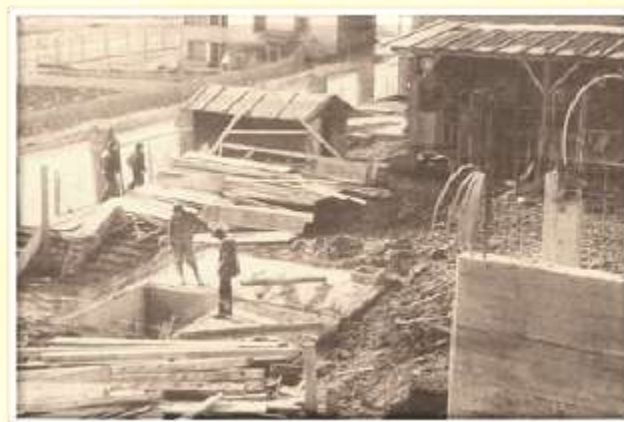
Gradnja dijaškega doma, poletje 1983.

24. 9. 1982 je bila sklenjena pogodba za gradnjo dijaškega doma in gradnjo so pričeli v oktobru leta 1982.