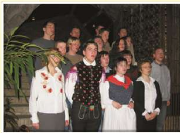
V Italiji se je iz grl naših dijakov razlegala slovenska pesem.

Opazili smo, da se kot avstrijska manjšina v Italiji trudijo ohraniti jezik, kulturo, razvito podeželje in gospodarstvo.