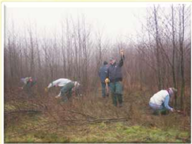
V duhu naravovarstva na Nizozemskem.

Dijaki so pridobili nova spoznanja, z veseljem so izvajali delo pri praktičnem pouku v tamkajšnjem parku naravnih vrednot. Profesorji smo pridobili informacije o pouku. Zasnovan je v obliki problemskega pouka, projektne delo, usvajanju poklicnih kompetenc.