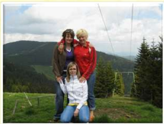
V dobri družbi sošolk se je lažje odpraviti v tuje dežele.

ERASMUS LISTINO obvezal, da bo deloval v mednarodnem duhu skozi vse študijsko leto, ERASMUS LISTINA pa bo objavljena na oglasni deski ŠC Šentjur ter na internetni strani ŠC Šentjur. Vse informacije v zvezi z mednarodnim delovanjem šole, z mobilnostjo študentov ter razpisi za mobilnost študentov so objavljeni na spletni strani naše inštitucije.