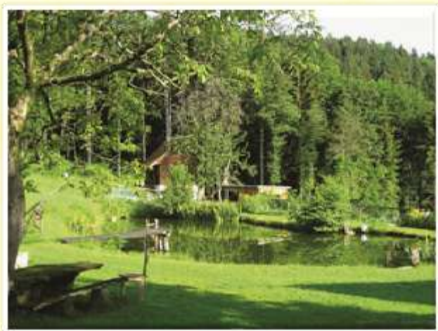
Ne le v Sloveniji, tudi preko meja se lahko pohvalijo z neokrnjeno naravo.

Sistematično delovanje na mednarodnem področju se je pričelo v letu 2006/2007, ko se je Višja strokovna šola Šolskega centra Šentjur prijavila na razpis Programa Evropske Unije za poklicno izobraževanje in usposabljanje za izvedbo projekta mobilnosti – Leonardo da Vinci 2006. Menili smo, da je zelo pomembno, da zainteresiranim študentom omogočimo opravljanje dela obveznega praktičnega izobraževanja v tujini, s čimer bi bodoči inženirji kmetijstva oziroma živilstva vstopili v evropski prostor, spoznali evropsko primerljivost na svojem strokovnem področju ter pridobili poklicne in osebne izkušnje, ki bi jim omogočile, da bi se v prihodnosti znali aktivno vključevati na trg delovne sile tako doma kot v tujini, da bi se znali na svojem poklicnem področju prilagajati konstantnim spremembam ter odgovorno ravnati kot državljani EU.