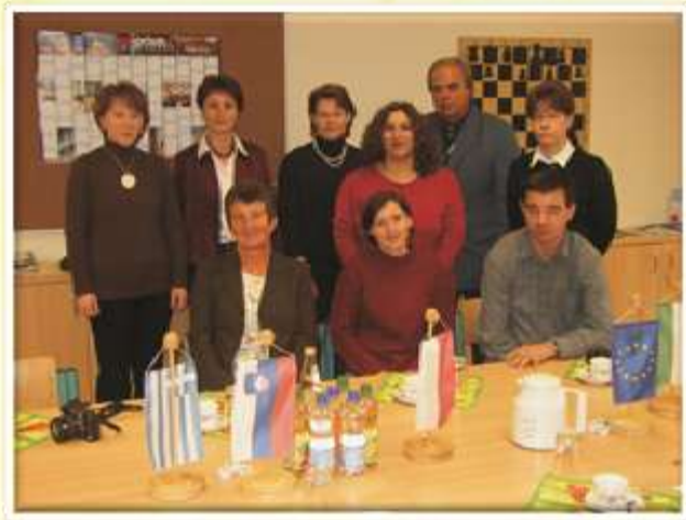
Med nami so se stkale pristne vezi.

Lastno identiteto dokazujemo s spoštovanjem bogastva kulture, jezikov, zgodovine našega kraja in drugih narodov. Nadaljujemo s tradicijo Ipvavcev.