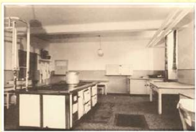
Kuhinja v šolskem domu leta 1970.