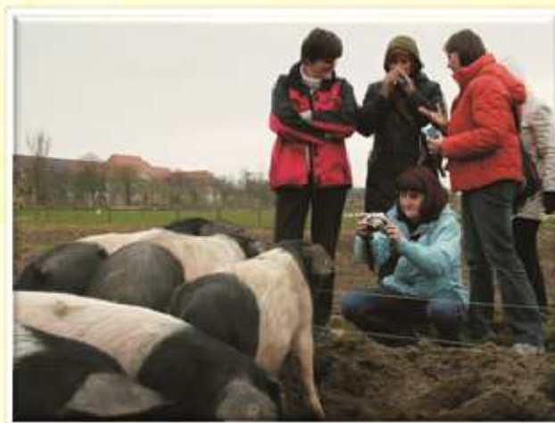
Na obrobju Berlina smo si ogledali ekološko kmetijo.

si med drugim ogledali tudi kmetijsko šolo na obrobju mesta. Ti dve ekskurziji sta bili prežeti z nostalgijo in s spomini na čase bivše Jugoslavije, saj še ni tako daleč nazaj, ko ... Posebej moški udeleženci so podoživljali razne dogodke s svojih mladih dni v vojski. Leta 2008 smo se potepali po Berlinu, mestu, ki se je tako