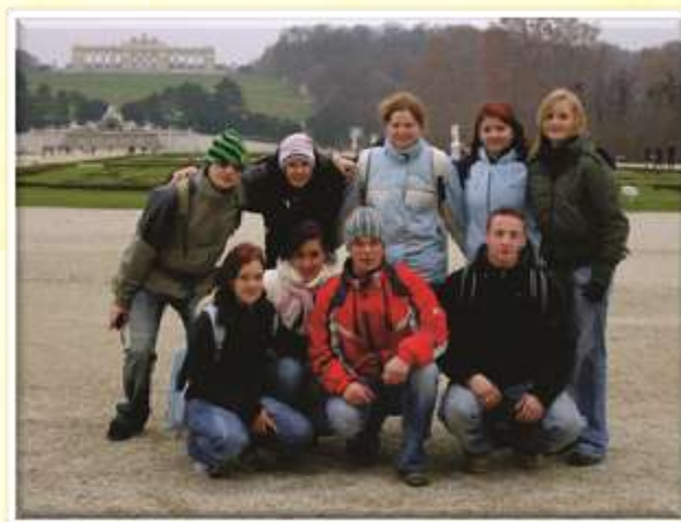
Ne le Haidegg, tudi dunajski Schönbrunn smo obiskali leta 2007.

V okviru projekta »Pridobitev praktičnih sposobnosti in kompetenc v kmetijstvu, živilstvu in turizmu«, so dijaki pridobivali in uporabljali praktična znanja, odkrivali, kako kmetovalec ali živilski delavec postane bolj kompetenten, kreativen in kako v bodoče spretno razvije delovna mesta na podeželju, v urbanih sredinah in živilsko pridelovalni industriji.