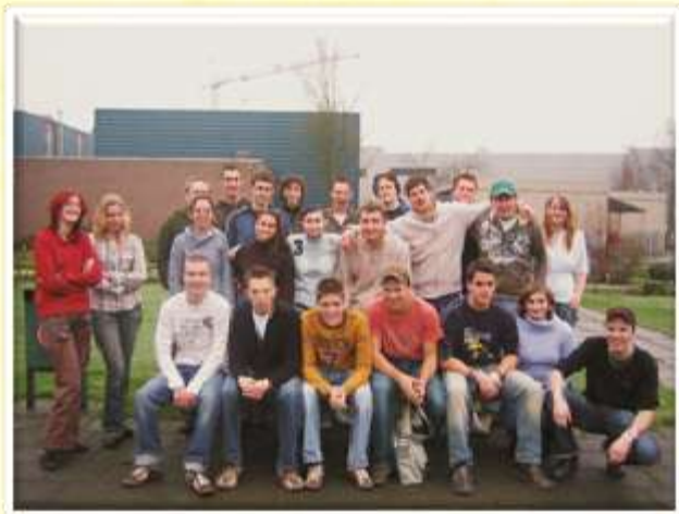
Naši in nizozemski dijaki pred Heliconom, februar 2007.