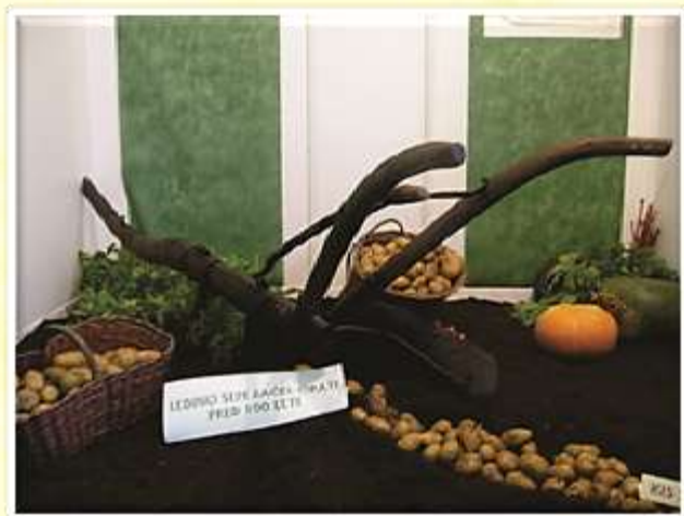
Razstavni prostor na sejmu Agra avgusta letos...

Že nekaj let se naša šola tradicionalno predstavlja na različnih sejmih s svojimi izobraževalnimi programi, z dopolnilnimi dejavnostmi in izdelki naših dijakov. Šolsko leto pričnemo na sejmu Agra v Gornji Radgoni v sklopu Konzorcija biotehniških šol Slovenije in samostojno s svojim razstavnim prostorom. Nadaljujemo na Jesenskem sejmu v Velenju, na povabilo mestne občine in TIC-a Velenje, na Bučijadi, ki jo organizira Ljudska univerza Šentjur in na Mednarodnem obrtnem sejmu Celje v jesenskem času. Spomladi pa se predstavimo na Flori v Celju, Spomladanskem gorenjskem kmetijskem sejmu v prostorih Agromehanike Kranj, Cvetličnem sejmu v Velenju in na Šentjurjevem v Šentjurju.