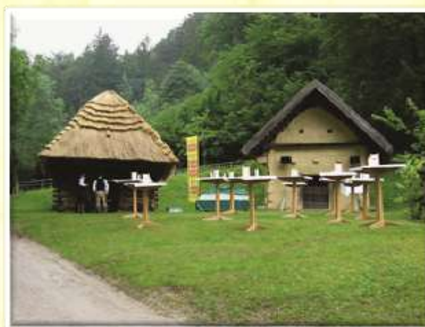
V Avstriji smo si ogledali Bio festival.

praktičnega izobraževanja v strokovno ustreznih podjetjih na Nizozemskem. Njihovo strokovno delo je spremljal in usmerjal mentor, strokovnjak v podjetju, ki je bil tudi odgovoren za ustrezno izvedbo programa in doseg zastavljenih ciljev, kot so priznanje praktičnega izobraževanja v tujini kot del študijskega programa, ki vodi do diplome ter pridobitev dokumenta Europass-Mobility.