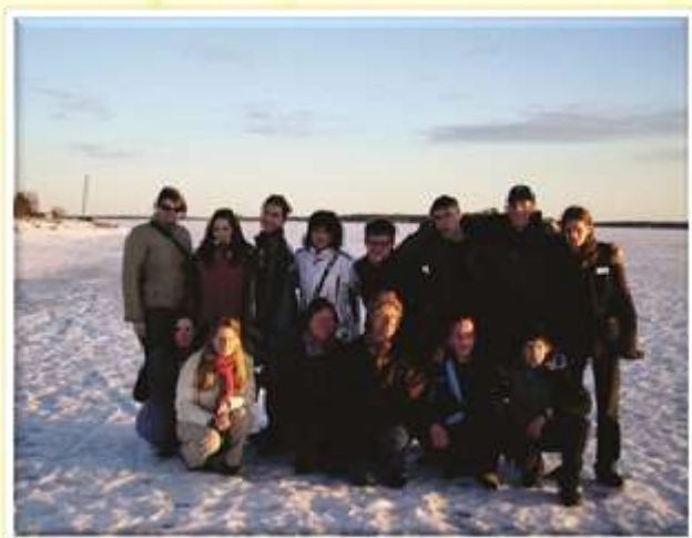
Na zasneženem severu - Finska 2009.

V šolskem letu 2008/09 smo v okviru projekta Leonardo da Vinci obiskali Finsko.