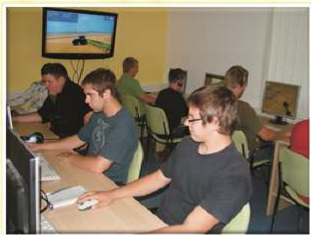
Računalniška učilnica za delo in zabavo.

sodelovali na velikonočni delavnici v Domu starejših, udeležili regijskih tekmovanje za Domijado. Prostovoljci so sodelovali v dobrodelni Petrolovi akciji Podari igračo in nasmeh.