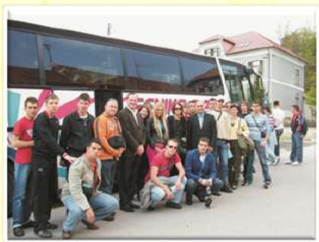
Dijaki s kmetijske šole v Futogu so nas obiskali že aprila 2008.

V šoli poteka veliko dejavnosti, s katerimi vzpodbujamo skrb dijakov za njihovo življenjsko okolje, tisti, ki jim okolje še posebej veliko pomeni, pa se izobražujejo v programu naravovarstveni tehnik. V šolskem letu 2009/10 smo sodelovali v mednarodnem projektu, imenovanem ACES (Academy of Central European Schools), ki smo ga kot šola koordinatorica skupaj izpeljali še z dvema partnerskima šolama: Kmetijsko in ekološko šolo iz Žatca na Češkem ter Kmetijsko šolo iz Futoga v Srbiji. Glavni cilj projekta je bil mednarodna izmenjava mnenj in idej o tej skrb vzbujajoči temi, poznavanje kulturne dediščine drugih dežel ter seveda medsebojno povezovanje in sodelovanje. Sam projekt je bil zasnovan tako, da je izmenjava izkušenj potekala na eni izmed treh gostujočih šol, ki so se je na dvodnevem obisku udeležili tako profesorji kot tudi dijaki dveh ostalih partnerskih šol.