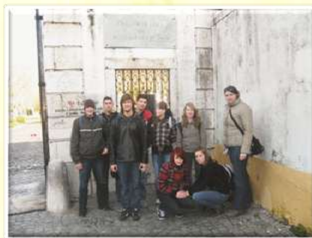
Na Portugalskem marca letos.