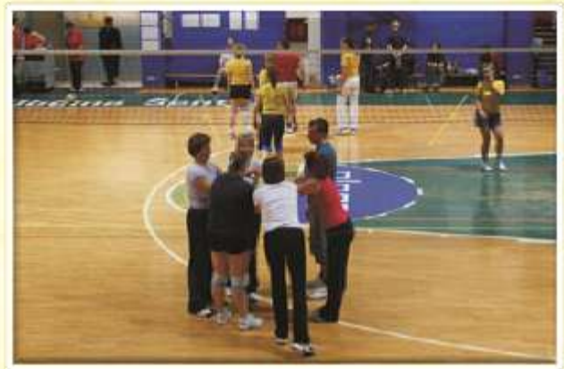
Tekmovanje v odbojki, april 2007.

organizacija SVIZ. Udeležujemo se športnih srečanj na območni ravni, sami pa omogočamo našim članom koriščenje fitnes studia v Wellnes centru Aspara. Ker pa vemo, da je poleg zadovoljnega in zdravega duha potrebnega še kaj denarja, smo že pred leti vpeljali namensko varčevanje. Danes ugotavljamo, da smo se odločili pravilno, saj se vedno več ljudi odloča na ta način prihraniti nekaj sredstev.