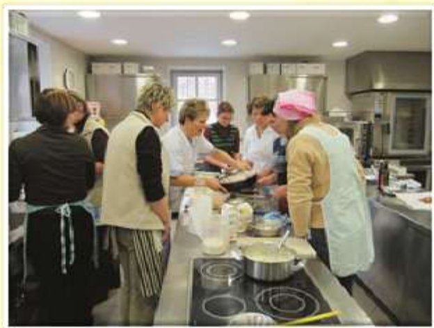
Tečaj kuhanja za absolvente naše šole.

Osnovni namen društva je še vedno povezovati člane in izpopolnjevati njihovo strokovno znanje z organizacijo tematskih predavanj strokovnjakov na področju kmetijstva, zakonodaje, ekonomike, trženja in sociologije. Redno izvajamo tečaje kuhanja in strežbe v prostorih šolske učne kuhinje in okrogle mize z aktualno tematiko.