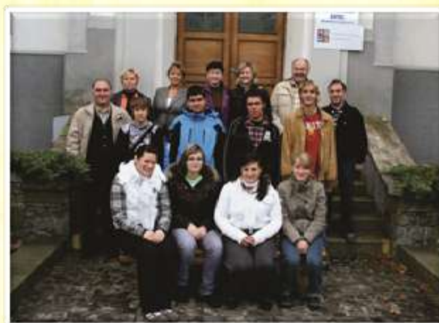
Pred pročeljem kmetijske šole v Žatcu na Češkem.

pripravi in organizaciji dvodnevne obiska čeških in srbskih kolegov. V Šentjurju smo jih gostili v mesecu marcu. Dijaki in profesorji so pripravili vprašalnik, s katerim smo želeli izvedeti, kakšen je posameznikov odnos do okolja in varovanja kulturne dediščine, predvsem pa nas je zanimalo, kaj pričakujejo od obiskov v tujih državah ter kaj bi še posebej želeli spoznati.