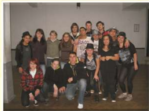
Mladost iz Šentjurja in Lizbone, marec 2010.

Vikendi so bili namenjeni željam dijakov. Raziskovali so stari del Lizbone z mestnimi znamenitostmi, obiskali boljši sejem, pravljico ribiško vasico Cascais, predel Belem z znamenitimi »pastais«, Ocenarium, ki je eden najlepših živalskih vrtov Evrope. Ogledali so si tudi stadion Benfica. Pravzaprav so videli ogromno, pa vendar je ostalo še toliko neodkritega.