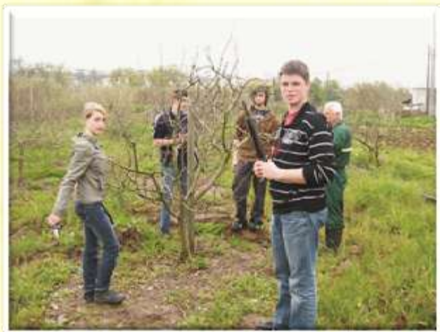
Praktični pouk na Centro de Línguas Intergarbe v Lizboni.

Koordinacija projekta zahteva veliko truda s strani koordinatorja, pa tudi s strani dijakov, ki se odločijo za novi izziv.