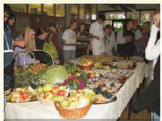
V sklopu projekta se dobro pripravimo na svetovni dan hrane in dijakom pomudimo »zdravje z mize«.