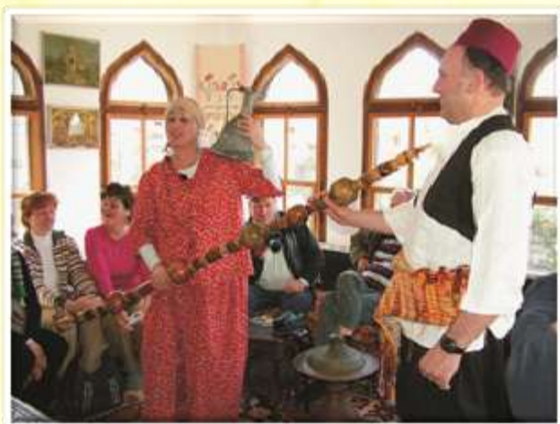
V Mostarju je bilo najbolj pestro v turški hiši.

Pravijo, da je dobro kdaj pogledati k sosеду, kako živi in dela, pa mogoče ti kaj prav pride. Tudi na naši šoli se trudimo nenehno izboljševati kvaliteto življenja, k čemur prav gotovo prispevajo vsakoletne strokovne ekskurzije. Poleg druženja, spoznavanja in razumevanja tujih kultur in navad si širimo obzorja s strokovnimi vsebinami.