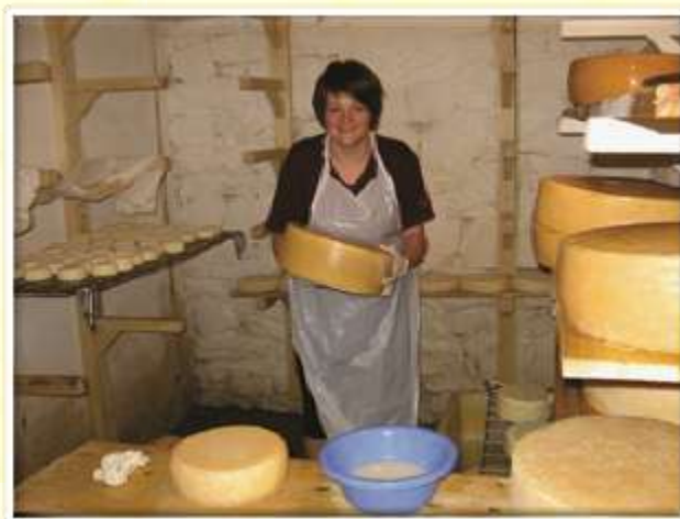
Na ekološki kmetiji v Avstriji smo se učili delati sir.

V študijskem letu 2007/08 smo petim študentom drugega letnika omogočili šesttedensko praktično izobraževanje na Portugalskem. V študijskem letu 2008/09 so štirje študenti opravljali šesttedensko praktično izobraževanje v Avstriji in študent 6-tedensko praktično izobraževanje na Nizozemskem. V študijskem letu 2009/10 pa je 5 študentov opravljalo 6-tedensko praktično izobraževanje na Portugalskem.