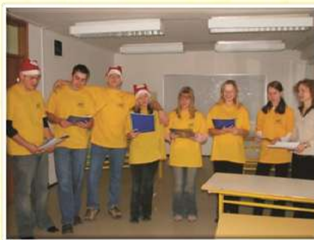
Zbor dijaškega doma, december 2006.