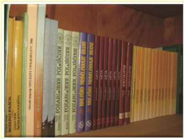
Naša knjižnica je dobro založena s strokovno literaturo.

Šolska knjižnica Šolskega centra Šentjur je namenjena dijakom, rednim in izrednim študentom, predavateljem, zunanjim udeležencem izobraževanj (razni tečaji, nacionalne poklicne kvalifikacije) ter ostalim zaposlenim v šoli. S knjižnim in neknjižnim gradivom, s svojimi storitvami in informacijami podpira delo zavoda. V vseh letih delovanja je postala informacijska točka šole.