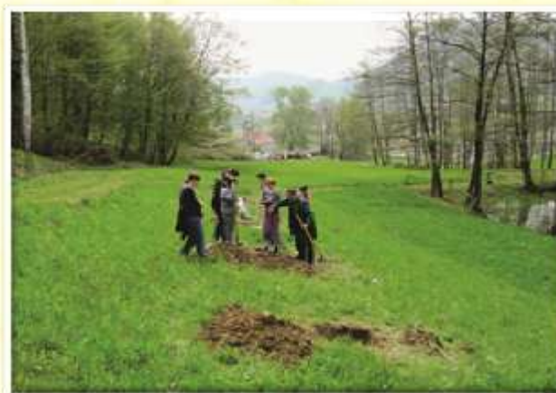
Na ekološkem delu posestva smo posadili sadike Bogatinke.