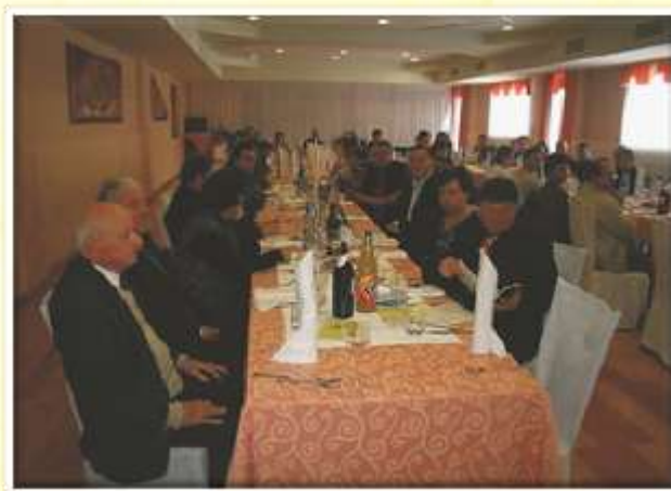
Občni zbor Društva absolventov, januar 2009.

dediščine, o pomembnosti okolju prijaznega kmetovanja, razvoju dopolnilnih dejavnosti na kmetijah, možnostih turistične ponudbe in trženja na kmetijah. Odprti smo za povezovanje s podobnimi in sorodnimi društvi na območju regije in Slovenije, saj naši člani, ki jih je okrog sto, prihajajo vsako leto na občni zbor iz vse Slovenije.