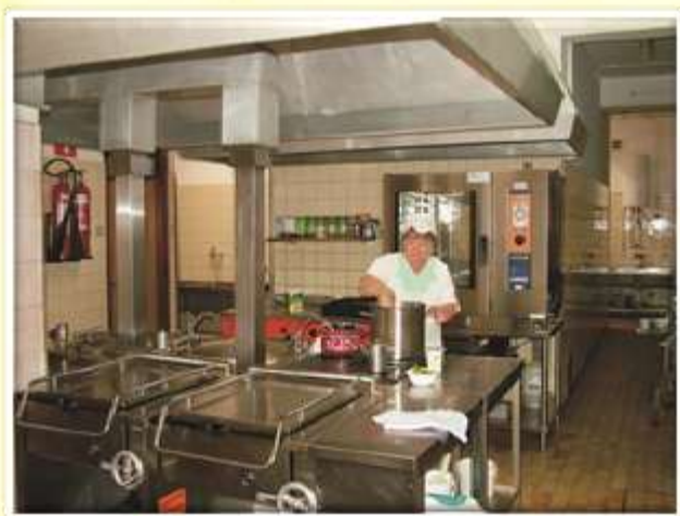
Šolska kuhinja leta 2010.

Dr. Ipavec je doživel še ugodno rešitev za ustanovitev šentjurske kmetijske šole, umrl je leta 1908.