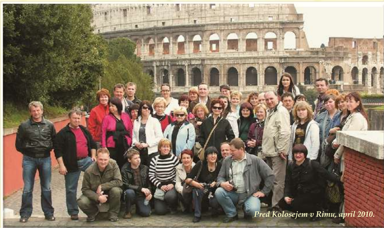
Pred Kolosejem v Rimu, april 2010.