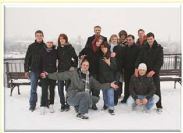
S srbskimi prijatelji v snežni idili v Novem Sadu.