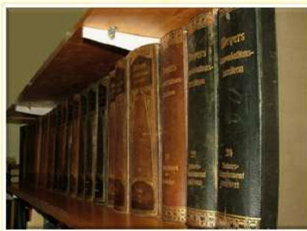
Na policah se najde tudi zbirka zavidljive starosti.

prehod razvrščanja gradiva na osnovi slovenske strokovne terminologije in mednarodno uveljavljene klasifikacije (univerzalne decimalne klasifikacije).