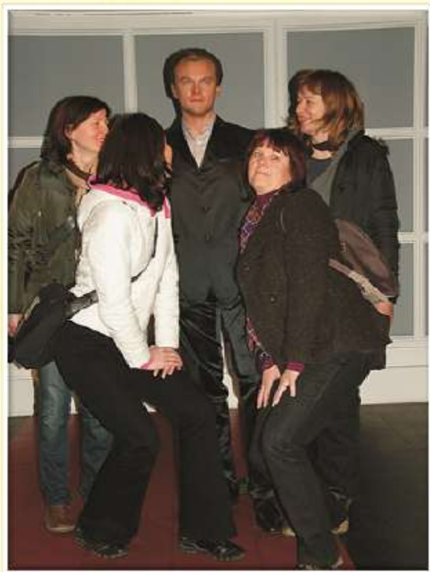
Ogled muzeja voščenih lutk Madame Tussauds v Londonu je bilo posebno doživetje.