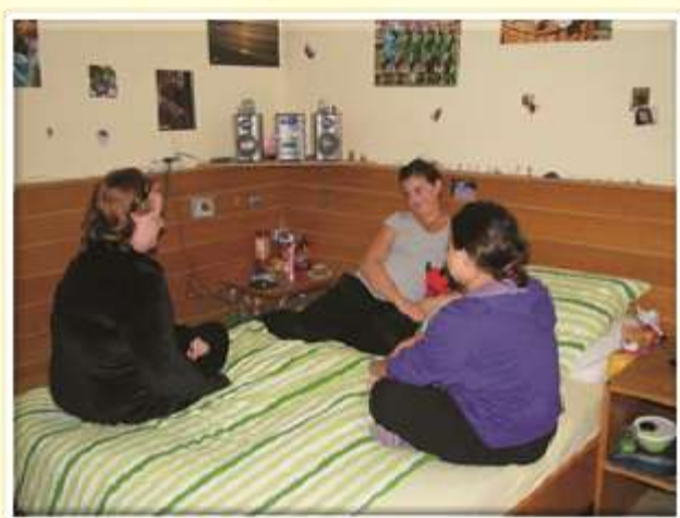
Soba v dijaškem domu leta 2010.