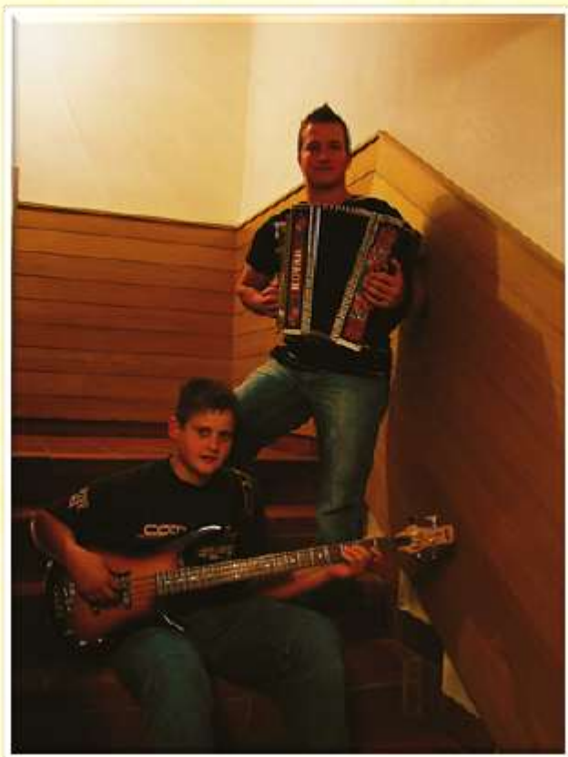
V dijaškem domu imamo vedno nekaj glasbeno nadarjenih dijakov.

Dijaki so se udeležili Domijade (košarka, mali nogomet, odbojka, šah). Prepleskali so tudi dijaški dom in sobe opremili z novimi zavesami.