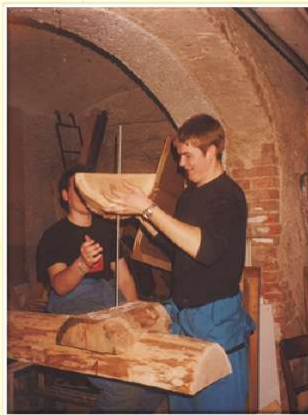
Naredili smo klopi in jih razporedili okoli šole.