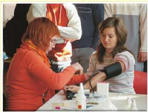
V sodelovanju z Rdečim križem OE Šentjur organiziramo merjenje sladkorja in krvnega tlaka.

V okviru Zdrave šole se trudimo privzgojiti dijakom zdrave življenjske navade, zdrav način življenja z dosti gibanja in pravilno prehrano. Za ohranjanje zdravja in preventivo pred boleznimi je izredno pomembno uživanje sadja in zelenjave. Pomembno je, da že mladostniki pridobijo zdrave prehranske navade, kajti prehranske navade, pridobljene v otroštvu in mladosti, ostanejo tudi v odrasli dobi vsaj v osnovi nespremenjene.