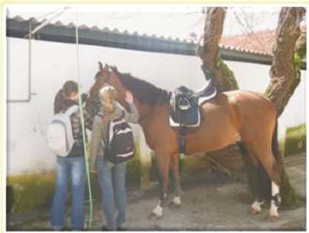
Živali so nam pomagale premagovati domotožje.

V letošnjem šolskem letu so nam tako bila s strani Nacionalne agencije odobrena sredstva za izvedbo mobilnosti na Portugalskem, zato smo že v mesecu oktobru pričeli z izbiro primernih dijakov, ki so svoje znanje angleškega jezika dokazali s pisanjem lastnega življenjepisa. Po izbiri osmih kandidatov pa so se začela resna dogovarjanja z ustanovo gostiteljico, ki je letos bila izobraževalni center Centro de Línguas Intergarbe v Lizboni.