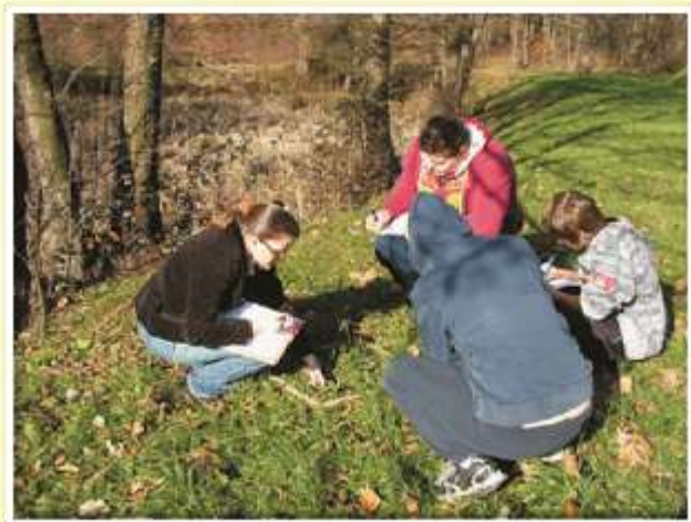
Mladi naravovarstveniki pri delu.

V aprilu 2008 se je Šolski center Šentjur kot ena izmed enajstih srednjih šol, ki izobražujejo po biotehniških programih (kmetijstvo, živilstvo, veterina, naravovarstvo, mehanizacija, hortikultura, gozdarstvo, okoljevarstvo, aranžerstvo) vključila v Konzorcij biotehniških šol za izvedbo projekta Biotehniška področja, šole za življenje in razvoj, ki traja v obdobju od 2008–2012. Razvojna prioriteta projekta je bila razvoj človeških virov in vseživljenjskega učenja oziroma izboljšanje kakovosti in učinkovitosti sistemov izobraževanja in usposabljanja.