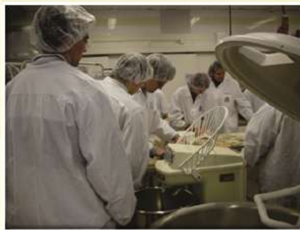
Namesto v Šentjurju smo mesili na Finskem.

Čudovita in zasnežena finska pokrajina, sredi gozda pa njihova avtohtona, na drva kurjena savna, imenovana tudi »smoked sauna«. Dnevi so hitro, skoraj prehitro minevali, učili so se, obiskovali pouk na različnih šolah, preučevali njihov način izobraževanja kmetijstva in živilstva, spoznavali ljudi in pridobivali nova prijateljstva.