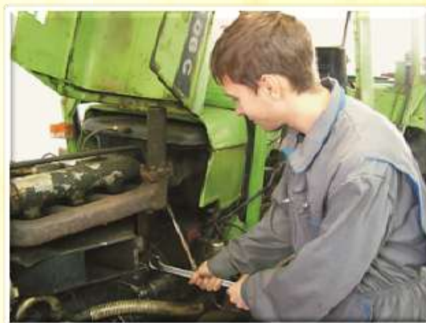
Kmetijskega mehanika smo preoblikovali v mehanika kmetijskih in delovnih strojev.

Za uvajanje teh programov je bilo potrebno izvesti devet aktivnosti, ki so usmerjene v naslednje cilje: