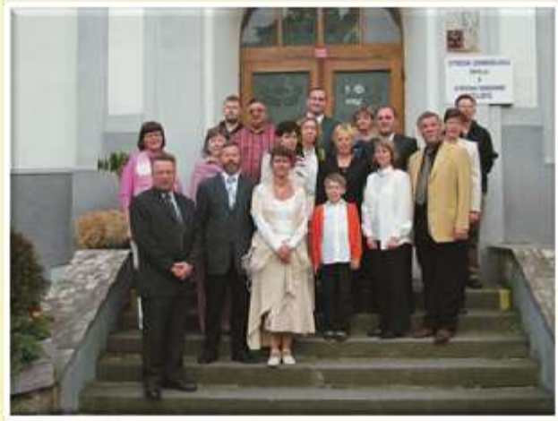
Mednarodne delegacije na obisku v Žatcu ob praznovanju 110-letnice tamkajšnje kmetijske in ekološke šole.

Obnovili smo že dolgoletna sodelovanja med šolama in načrtali nove aktivnosti. Skupaj sodelujemo v projektu ACES, v okviru okoljevarstvenih in naravovarstvenih vsebin. V tem projektu sodeluje še kmetijska šola iz Futoga iz Srbije.