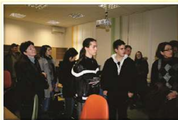
Dijaki s Češke in iz Srbije so bili navdušeni nad našo računalniško opremo.

Naučili smo se veliko novega, dobili marsikatero idejo, predvsem pa smo vsi prišli do spoznanja, da bo treba še marsikaj narediti, da ohranimo našo deželo tudi za prihodnje rodove.