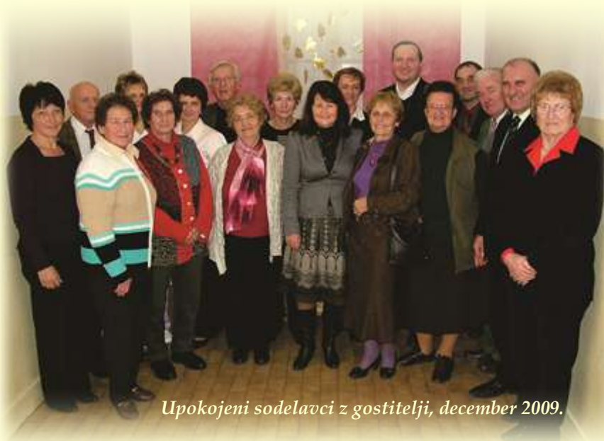
Upokojeni sodelavci z gostitelji, december 2009.