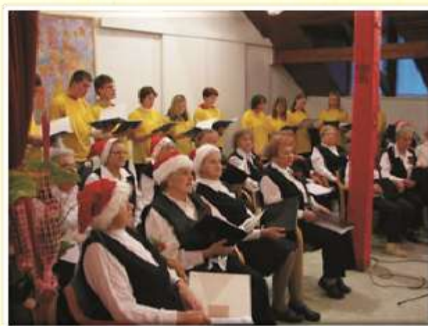
Božično-novoletni koncert v Domu starejših Šentjur, december 2006.

V dijaškem domu smo zamenjali okna ter obnovili kopalnice v II. nadstropju. Prostovoljci so enkrat tedensko odhajali v Dom starejših Šentjur, zbirali smo oblačila in igrače za otroke iz sirotišnice v Aleksincu. Udeležili smo se božično-novoletnega koncerta v Domu starejših Šentjur. Izvajali smo delavnice z zunanjimi sodelavci, ZD Šentjur ter Radiem Celje. Udeležili smo se regijskega tekmovanja ter sodelovali na Domijadi na Rogli.