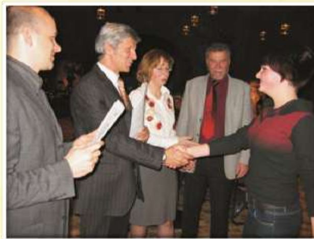
Naši dijaki so prejeli certifikate na slovesni podelitvi v Laimburgu.

himno in njihovo staro tirolsko domoljubno pesem v nemščini.