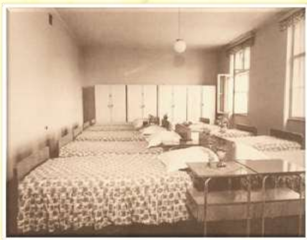
Spalnica gospodinjske šole leta 1970.

Organizacija kmetijskih šol je v letih 1945–1952 spadala v delokrog Ministrstva oziroma kasneje Sveta za kmetijstvo. Internatska oblika kmetijskih šol je omogočala, da vzgojno delo ni bilo vezano le na kratke šolske ure, pač pa je bilo dovolj časa za praktični pouk in za delo v proizvodnji ter tudi za prosvetno, kulturno ter politično in končno tudi kolektivno vzgojo mladine.